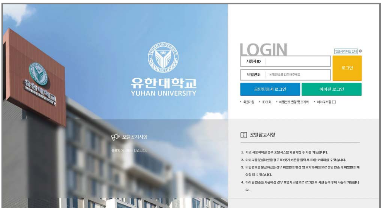
<그림 2.1-1> 로그인 화면